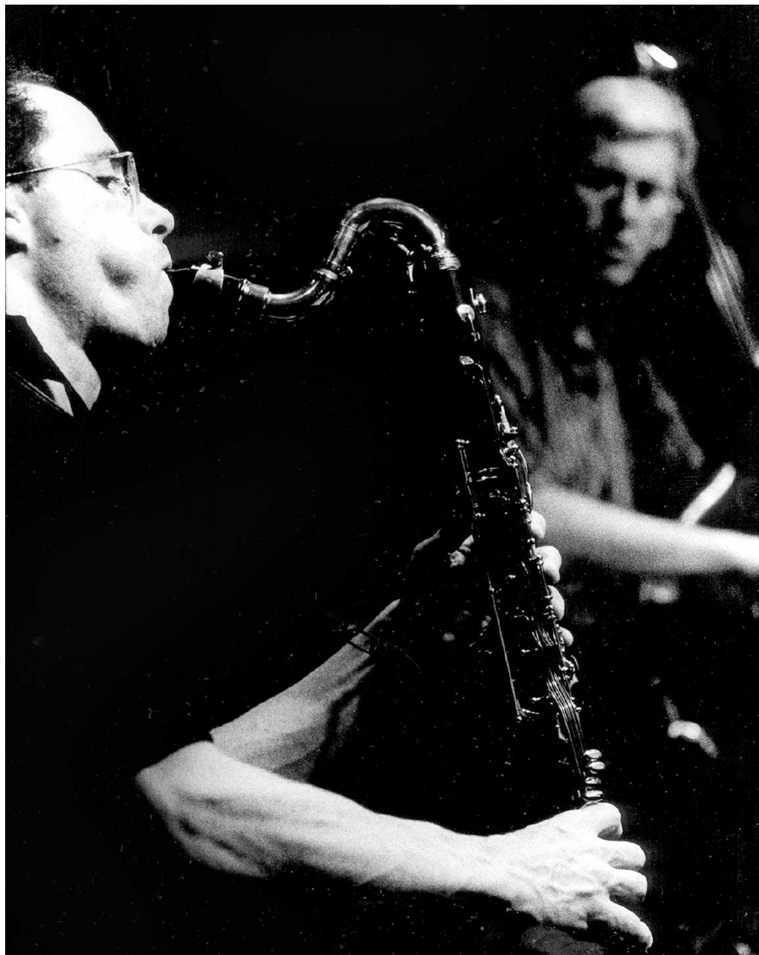
Ned Rothenberg: 'Rare noten op zich zijn niet interessant, het gaat erom wat je ervoor of erna speelt.'